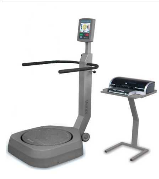
شکل ۱. دستگاه سنجش تعادل بایودکس

از دستگاه اندازه‌گیری پایداری قامت ساخت شرکت بایودکس آمریکا برای سنجش کنترل قامت استفاده شد. این دستگاه قابلیت تنظیم پایداری از سطح ۱ تا ۱۲ و ۲۰ درجه تغییر زاویه نسبت به سطح افقی در تمام جهات را دارد. روایی ۲ دستگاه تعادل سنج بایودکس در مطالعات مختلف تأیید شده است (۲۷، ۱). پایایی ۳ (تکرارپذیری) دستگاه تعادل سنج بایودکس نیز در مطالعات مذکور تأیید شده است.