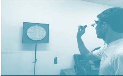
شکل ۱. نحوه ارزیابی خیرگی و حرکتی پرتاب دارت

شامل ۲ کانون توجه (بیرونی و درونی) در ۲ بار تکلیف ثانویه (برآورد و عدم برآورد تن صدا) بود. هر شرایط شامل ۱۸ کوشش در قالب ۶ بلوک ۳ کوششی بود. شایان ذکر است بعد از هر سه کوشش پرتاب دارت آزمونگر دارت‌ها را بازیابی می‌کرد و کالیبراسیون دستگاه بررسی شد. بین هر بلوک ۳۰ ثانیه و بین هر شرایط نیز ۲ دقیقه استراحت داده شد که در این زمان نیز دستورالعمل‌های توجیهی ارائه می‌شد.